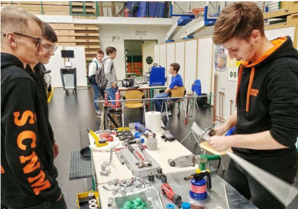
ŠC Novo mesto Dan odprtih vrat 2019