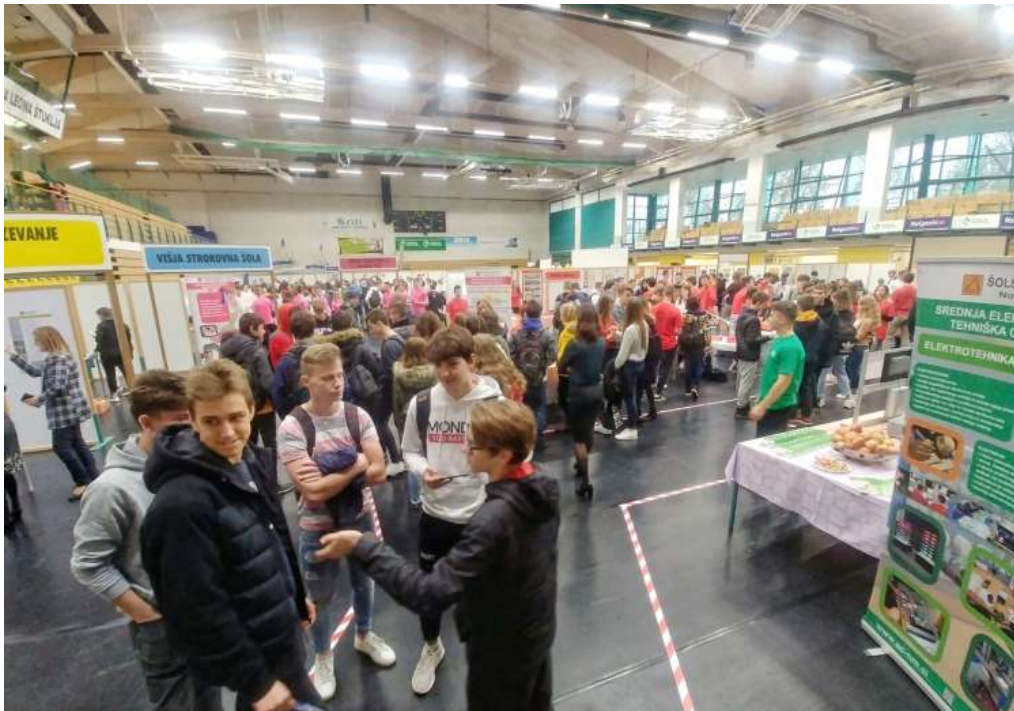
ŠC Novo mesto Dan odprtih vrat 2019